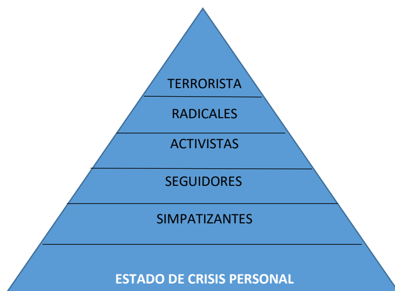
Figura 1. Propuesta Modelo de pirámide

No existe entre la comunidad académica un acuerdo unánime sobre la importancia o el grado de influencia que tienen estas etapas en el individuo (Moyano, 2010, 19). Tampoco sobre los mecanismos que se activan en cada persona para pasar de una a otra etapa o la aparente escasa existencia de un orden secuencial por la que pasan estos individuos de una a otra fase. Sin embargo, la metáfora de la cinta transportadora presupone que las personas tenderían a radicalizarse y a ir subiendo escalones progresivamente (Moskalenko y McCauley, 2009). No existe mucha evidencia empírica que respalde dicha metáfora y el planteamiento de investigación que desarrolla este estudio puede arrojar luz sobre este aspecto.