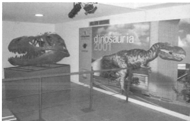
Entrada a la Exposición temporal "Dinosauria 2001".

Y como todo esto no tiene sentido alguno si no es por los visitantes que acuden, no se descuida tampoco en enfoque lúdico, habiéndose seleccionado los contenidos de modo que la visita sea divertida y ocupe un lugar entre la oferta de actividades para el tiempo de ocio de su entorno.