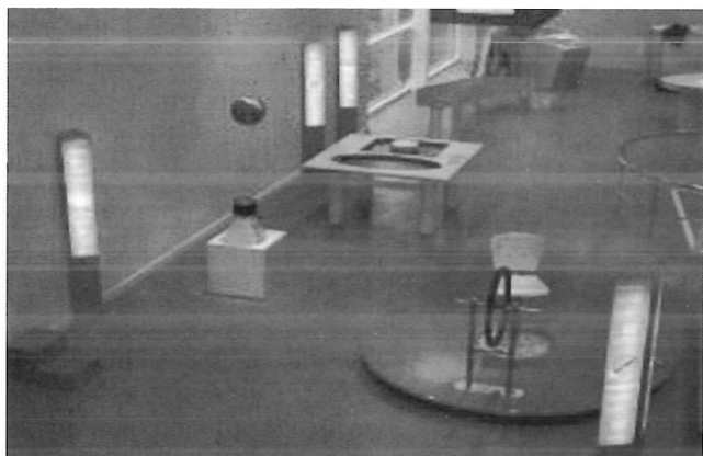
Vista parcial de la Sala "Mundo Mecánico".

visitante entre en contacto directo –participativo—con aspectos científicos y pierda el miedo a la ciencia. Es ese temor, mezcla de respeto y mitificación, el que a final de cuentas impide que, así como está extendida la impresión de que “cultura” significa saber de historia, geografía y literatura, ésta incluya una mínima base científica, tan necesaria para el desarrollo de la democracia del tercer milenio, en el que gran cantidad de las decisiones de gobernantes y ciudadanos versarán sobre aspectos científicos, como ya es el caso a finales del siglo XX.