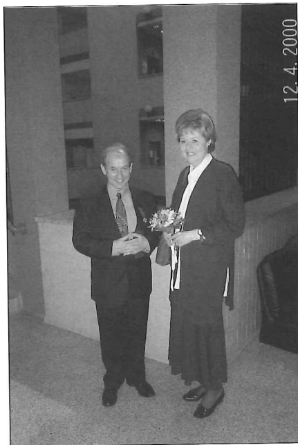
El Profesor Karl Johan Åström y su esposa.

Posee numerosos trabajos en Matemática Pura. Todos ellos han sido publicados en revistas de gran prestigio internacional y muchos de ellos han sido ampliamente citados por la novedad de los resultados y por la repercusión que han tenido en otros campos de las matemáticas. Los artículos escritos en los años setenta, concernientes a los grupos Fuchsianos y grupos NEC y sobre las uniformizaciones de las superficies de Riemann y de Klein, han sido