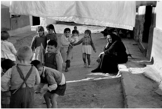
Fig 15. Pérez Siquier 1958. Web Centro Pérez Siquier