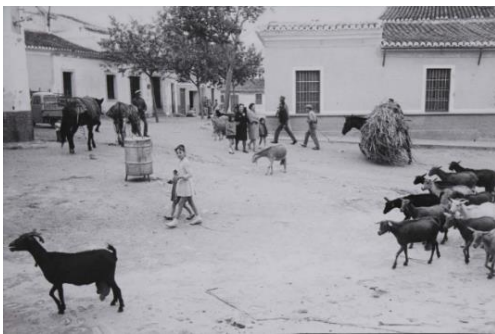
Fig 13. Ramón Masats. Iznalloz (Granada) 1961

La gran parte de la sociedad que estaba en edad adulta para trabajar, habían emigrado a Europa, América o de pueblos a grandes ciudades industrializadas en España. Era muy cotidiano en la fotografía documental mostrar tanto el escenario real de un día normal de un pueblo (Fig 13) 182 , del que la gente quería salir, hasta el hecho de la emigración de los pueblos a las ciudades, con sus únicas pertenencias en varias maletas y quizás sin casa porque la tuvieron que vender para sacar los billetes de tren (Fig. 14) 183 .