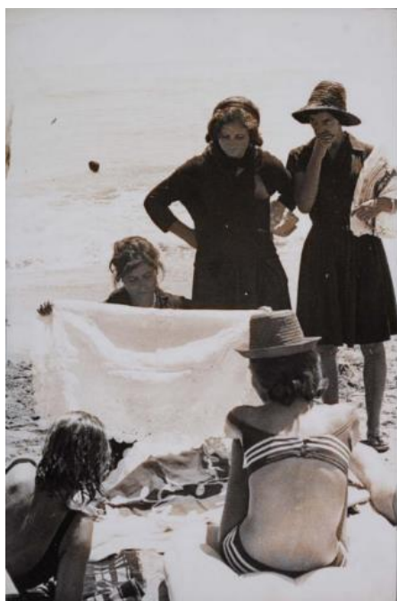
Fig 21. Torremolinos. Ramón Masats. 1961.

en libertad y qué mejor que la gente viva bien, concluyendo con la frase “a la fotografía, que le den por saco” 192 . Masats recoge escenas del incipiente turismo de los sesenta como una escena cotidiana (Fig 21) 193 , o capta un instante anónimo en el Museo del Prado, mostrando la sociedad cultural del momento (Fig 22) 194 .