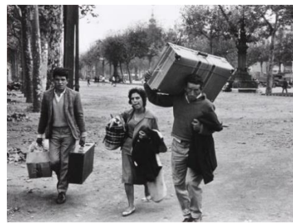
Fig 14. Xavier Miserachs. Estació de França.Barcelona. 1962