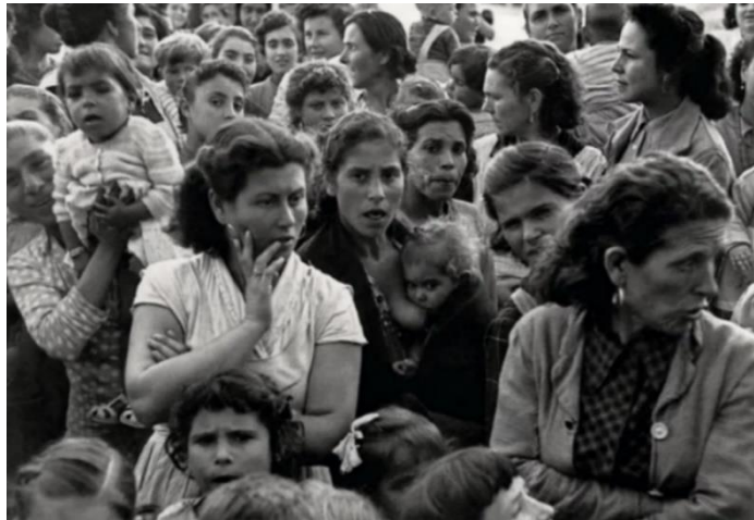
Fig 19. Pérez Siquier, La Chanca , 1957

y de las madres casi en exclusividad (Fig 19) 188 , ya que éstas veían a sus maridos una o dos veces al año cuando volvían de altamar y producto de ello era muy frecuente que quedasen embarazadas.