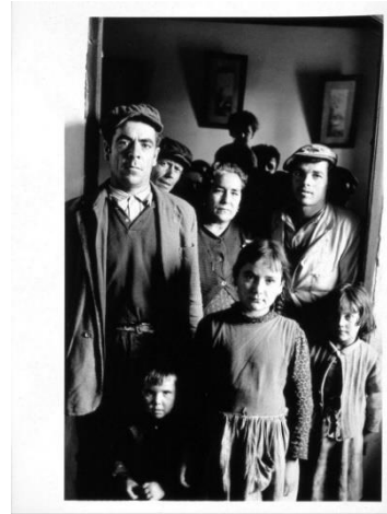
Fig 16. Familia Andaluza, Ontañón. 1960