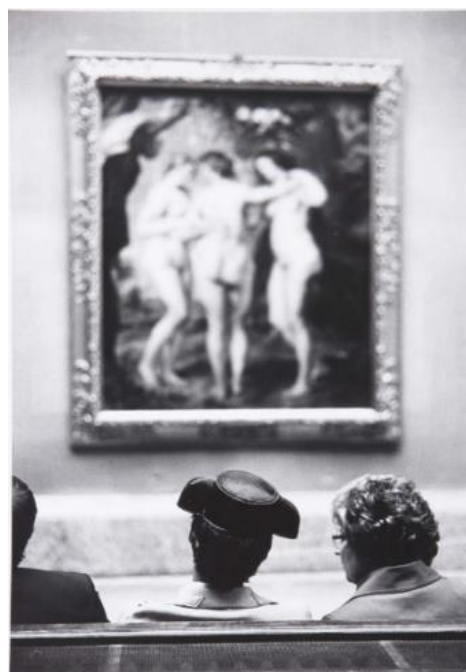
Fig 22. Museo del Prado. Madrid. Ramón Masats 1962

En un momento concreto del documental expresan con palabras los deseos e intenciones que anhelaban todos los fotógrafos que trabajaban de forma altruista con esta revista, expresándolo así: