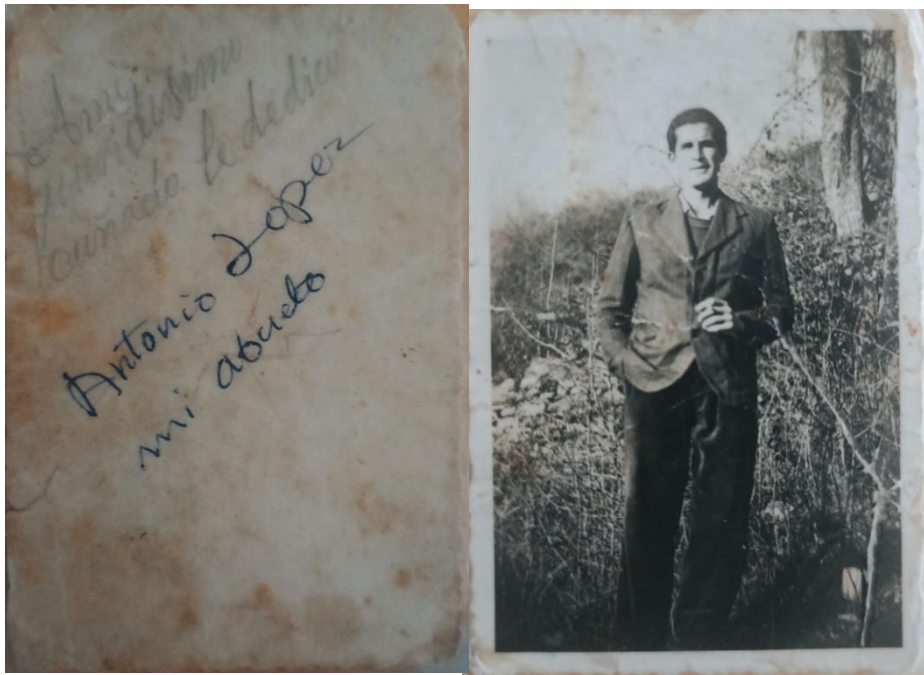
Fig 6. Anverso y Reverso de fotografía del desaparecido, vuelta a hallar recientemente.

Durante la Guerra Civil Española, el desaparecido se tuvo que marchar a Francia por temor a represalias políticas. Según el relato que me trasladan de la historia de mi abuelo, confiaban en que hubiese comenzado una nueva vida como emigrante, forzado por estas circunstancias políticas. La única imagen que se obtuvo del desaparecido fue captada desde algún lugar desconocido de Francia (fig. 5) y la pudo conseguir su hija cuando ya era adulta, a través de un amigo de su padre. Esta fotografía se amplió para adaptarla a un soporte adecuado a la importancia que le querían dar, aunque perdiese en calidad. Lamentablemente, la fotografía original está en paradero desconocido. Ha tenido diversas ubicaciones dentro del hogar familiar, pero siempre manteniendo intacta su importancia como imagen vertebradora del relato que se quería transmitir de él.