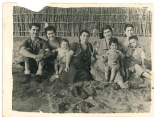
Fig 4. Familia del desaparecido.