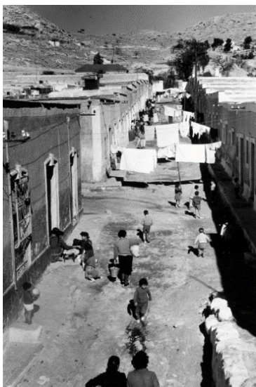
Fig 7. S/T (La Chanca) Almería. Carlos Pérez Siquier. 1957

Como conclusión sobre este hecho, Calvo y Prieto aportan como información sobre este documental prohibido que