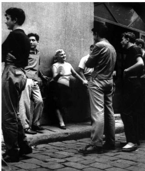
Fig 20. Joan Colom S/T 1960.

fotografía de momentos improvisados y todos están de acuerdo en que en la sociedad actual las miradas y los comportamientos han cambiado. Masats concretamente realiza esta afirmación sobre los comportamientos de aquella época y de ésta: “La gente no estaba tan resabiada como ahora. La televisión la ha resabiado muchísimo. Antes, la gente era mucho más inocente” 191 , pero a la misma vez afirma que la gente ha ganado muchísimo