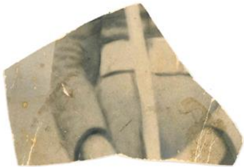
Fig 2. Fragmento de fotografía del desaparecido.

De un recorrido en la construcción de un discurso en el que la persona siempre forma parte, aunque sea de forma subyacente, un trozo de fotografía se puede convertir en una imagen vertebradora de la historia familiar con la persona desaparecida cuya familia, y más concretamente su hija, nunca perdió la esperanza de volver a verlo.