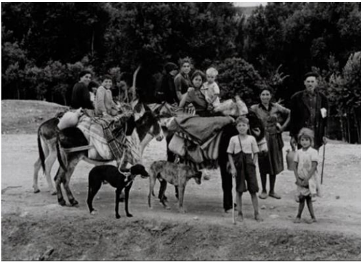
Fig 17. Familia Nómada en la Mancha. Oriol Marpons