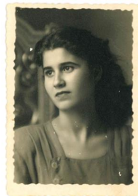
Fig 3. Hija del desaparecido.