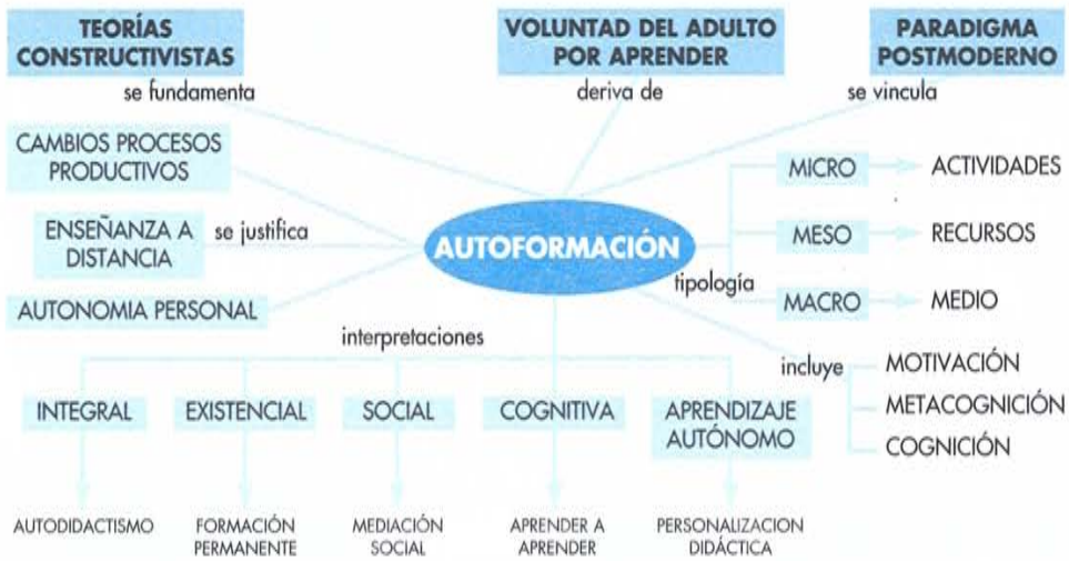
Figura 1: Mapa conceptual de la autoformación propuesto por el autor