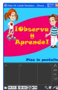
(a) Pantalla Inicial

En el área de Matemáticas, como se ha detectado que el eje con mayor dificultad es tratamiento de la información, entonces se planeo diseñar una aplicación para auxiliar en el aprendizaje de este eje. En este eje la SEP propone actividades en las cuales se desarrolla en los niños la capacidad para resolver problemas y tratar con la información. Para lograr esto plantea que los niños analicen y seleccionen información planteada a través de textos, imágenes u otros medios. Así como representar e identificar información a través de gráficas y tablas. Por lo cual no se debe salir del contexto, y realizar la aplicación con base a las actividades que se llevan a cabo en los libros gratuitos de primer grado de primaria.