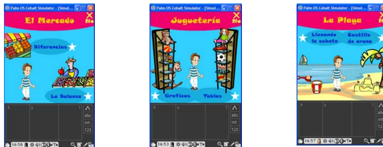
Fig. 7. Pantallas del juego Observa y Aprende: Actividades en cada escenario.

En el juego se les pide el nombre al niño para llevar un control de sus puntos, por cada escenario que complete se les dan un cierto puntaje asociado con una estrella. Los escenarios con los que cuenta el juego son tres: un mercado, una juguetería y una playa (Fig. 7). En el escenario del mercado, el niño puede resolver problemas sencillos de diferencias, y puede contar por medio de una balanza. En la juguetería, el niño observa gráficas y tablas para contar cantidades y responder preguntas sencillas. En la playa, el niño cuenta y observa imágenes para contestar preguntas sencillas, como: ¿Con cuántas palas se lleno la cubeta? ¿Cuántas puertas tiene el castillo? entre otras.