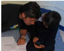
Fig. 1. Pruebas de usabilidad de PDAs.

Cinco personas estaban involucradas en cada prueba: un niño como participante y un estudiante como facilitador en un lado del espejo medio-transparente del laboratorio, y dos profesores como observadores, junto con un técnico quien controló la grabación en vídeo. Tanto el facilitador como los observadores tenían en papel las tareas a desarrollar, para realizar anotaciones de sus observaciones y de las respuestas de los participantes. Sin embargo, estas hojas funcionaban para el facilitador nada más como una guía para llevar a cabo la prueba porque toda la interacción entre él y los participantes fue realizado más bien como una plática informal o bien como en forma de un juego (Fig. 1).