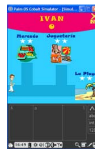
(b) Pantalla de Escenarios