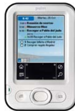
Fig. 2. Palm Z22