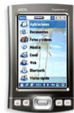
Fig. 3. Palm Tungsten T5

Las tareas incluyeron las preferencias de primera vista, después de haber interactuado con el hardware usando también el stylus y después de haber usado la aplicación para dibujar. Se capturaron las dificultades que los niños presentaban en la interacción vía