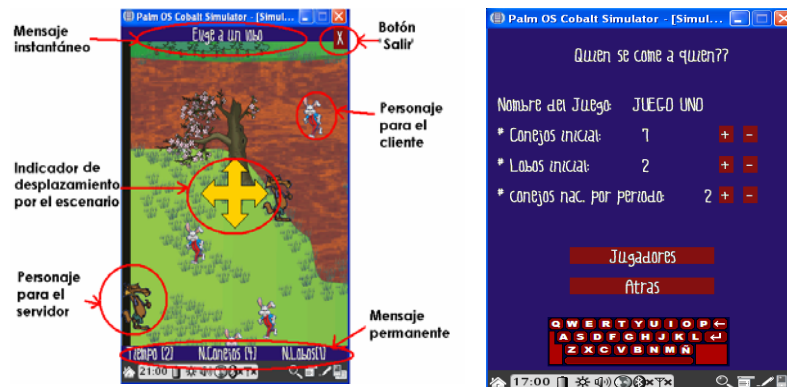
(a) Escenario y personajes

en estas pruebas, fue que los niños si trabajaban en forma colaborativa, dado que charlaban para acordar como mantener el ecosistema en equilibrio, y que los dispositivos afectan el desempeño de los niños, dado que deben ser ligeros y pequeños, y deben ser del mismo modelo, dado que ellos muestran desconfianza porque piensan que uno es más rápido que otro y que sus teclas de navegación son diferentes y por eso sus personajes son lentos o veloces. En lo que respecta a la aplicación se notó que el niño al estar entusiasmado con el juego no observa los mensajes donde se les indica que el ecosistema está en desequilibrio, y que los lobos o conejos se han muerto, por lo que se optó por colocar advertencias auditivas a dichos mensajes, dado que si colocamos mensajes de un mayor tamaño afectaría la zona de movimiento de los personajes y del escenario. Se cambiaron algunas palabras como “++info” que significaba para nosotros observar mas información del juego al concluir, y el sugirió colocar la palabra “Resultados”.