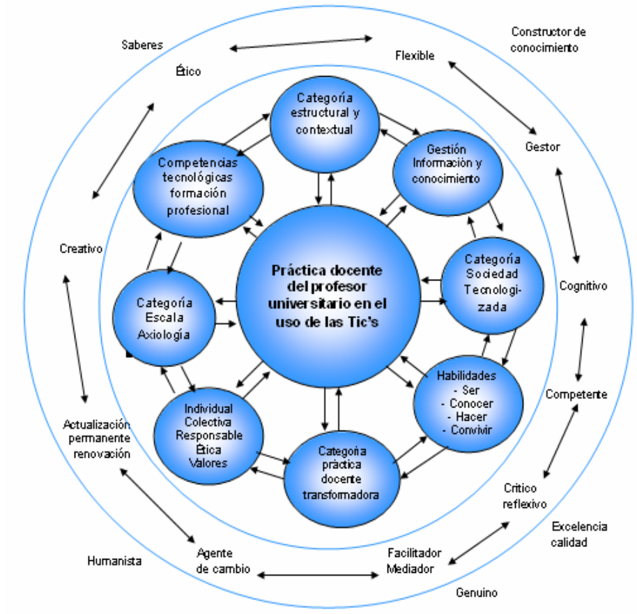
Figura 13. Teoría sustantiva fundamentada sobre la práctica docente del profesor universitario en el uso de las Tic's.