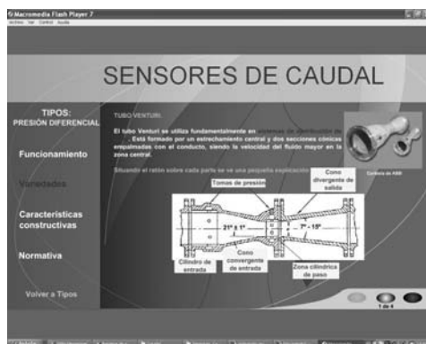
Figura 1. Pantalla ejemplo de la aplicación.

El cumplimiento de algunos de estos objetivos iniciales se cubren con el desarrollo de la herramienta multimedia que se presenta a través de esta comunicación (ej. de aspecto externo en la Fig. 1). También se pretenden cubrir algunos otros temas secundarios relacionados con lo anterior, como son la revisión del estado actual de la técnica en cuanto a este tipo de sensores, la revisión de las tendencias y soluciones de futuro, aspectos relacionados con la experiencia de profesionales del sector y desarrollo de teoría de mecánica de fluidos.