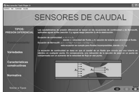
Figura 2. Muestra del aspecto de la aplicación principal.

aplicación condicionan su estructura, que presenta las siguientes partes o bloques temáticos: Introducción, Tipos, Aplicaciones, Características técnicas, Señales de salida, Fabricantes, Normativa. Cada uno de estos bloques constituye una parte independiente del software, aunque los temas tratados para cada tipo de sensor de caudal son similares y la forma de estudiarlos también es similar en todos ellos. En cada tema, o bloque destinado a explicar cada tipo de sensor, se sigue una estructura que incluye el análisis de los principios físicos en los que se basa la medida de caudal, los modos de operación y funcionamiento del sensor, las características eléctricas, mecánicas y operativas, las aplicaciones típicas, los tipos de salidas eléctricas, estándares y normas, clases de protección, hojas técnicas de fabricantes. Estos conceptos se exponen a través de texto explicativo, con gráficos de ayuda, imágenes, animaciones, simulaciones interactivas en las que el usuario de la aplicación se puede involucrar con facilidad, y vídeos explicativos sobre el funcionamiento y la implantación en la industria de los sensores de caudal (ej. en Fig. 2). También se ofrecen catálogos, hojas de características y se aportan enlaces a páginas Web de fabricantes [13],[14],[15],[16],[17],[18] con el fin de tener información actualizada y real de los productos existentes en el mercado.