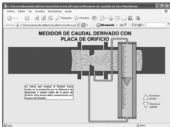
Figura 4. Simulación de una placa de orificio con medidor.