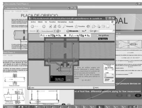
Figura 3. Simulaciones de la herramienta desarrollada.

Se pretende que el sistema tenga un doble enfoque, teórico y práctico, al que se intenta añadir un grado de conocimiento derivado de la experiencia de profesionales del sector. La idea del enfoque es aunar explicaciones teóricas y soluciones prácticas habituales, para una completa visión del tema de medida de caudal en la industria.