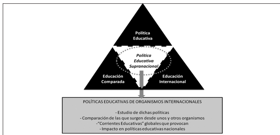
Figura 2. Objetos de estudio de la Política Educativa Supranacional