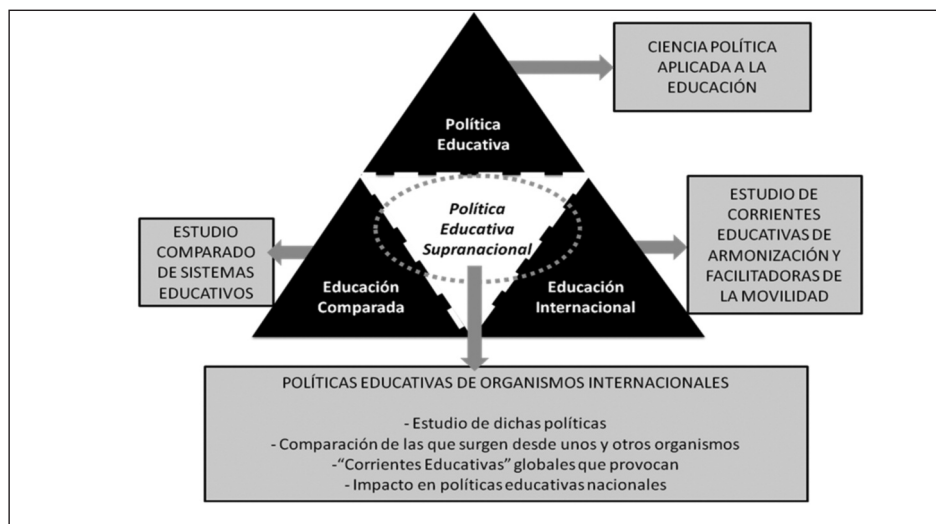
Figura 3. Propuesta para un contraste delimitador de los objetos de estudio de la Política Educativa , la Educación Comparada , la Educación Internacional y la Política Educativa Supranacional