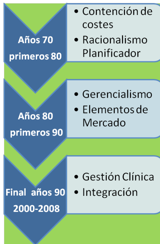
Figura 1: Los seis patrones de cambio y reforma en su marco temporal

El caso español es un tanto diferente, pues las condiciones políticas y económicas de la transición a la democracia imprimieron un desfase cronológico; en el Anexo segundo del presente tema se aborda la cronología particular de los patrones en España.