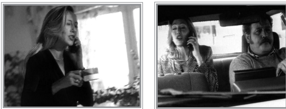
Fig. 2. Unión signo-usuario. Movistar (Telefónica, 1996)

¿Qué función tiene Movistar? ¿Cómo aparece representado? Mientras que todo fluye rapidísimo en la vida cotidiana laboral, la posesión del objeto permanece siempre en contacto con el sujeto, siendo la única constante del discurso.