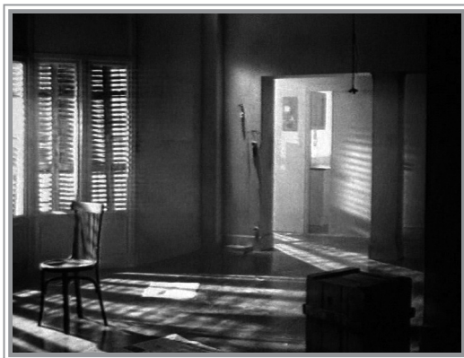
Fig. 4. Reconocimiento de la identidad del signo. Movistar (Telefónica, 1997)

Como vemos, la verticalidad, lo circular, y la luz forman parte del imaginario identificativo de la marca Movistar para el usuario-consumidor.