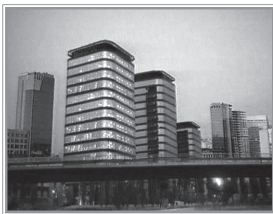
Fig.1. Imagen espacial de la ciudad, Movistar (Telefónica, 1996)

Efectivamente, nos encontramos ante un espacio utópico estético en el que lo tecnológico vertebrata el ambiente idealizándolo hacia el progreso y ocultando el espacio de la miseria y los suburbios sociales.