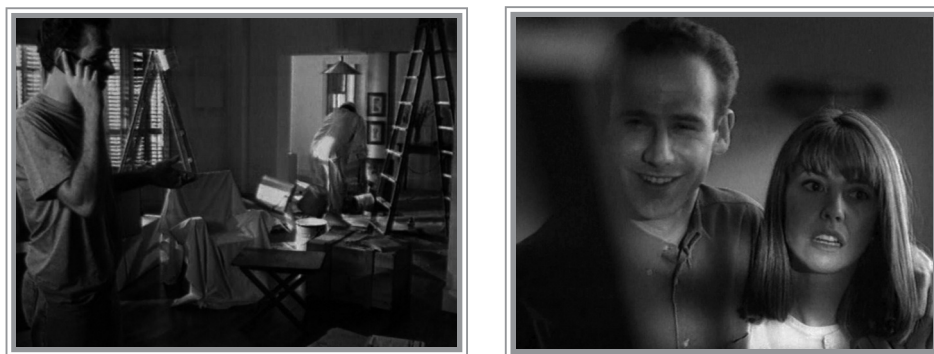
Fig. 3. Gestualidad ante la adversidad, Movistar (Telefónica, 1997)

En él nos encontramos a una pareja leyendo el periódico en un bar al mismo tiempo que llaman por teléfono. A continuación observan una casa, la suya, que se acaban de comprar. En ese momento la felicidad de su expresión facial se torna en sorpresa desagradable dado el estado de abandono que presenta la casa.