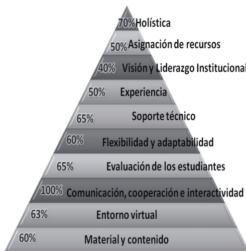
Figura 2. Porcentajes de cumplimiento en los criterios de calidad del modelo ELQ del CVU

Este trabajo de investigación tiene como fin identificar la calidad que guarda la educación a distancia en la UPPuebla, ofrecida a través del CVU, mediante la aplicación del método ELQ descrito anteriormente. Los resultados obtenidos incluyen el análisis de las respuestas del cuestionario mostrado en la tabla 1, así como la interpretación de los hallazgos encontrados mostrados a través de un gráfico triangular que representa los diez aspectos que el modelo aplicado incluye.