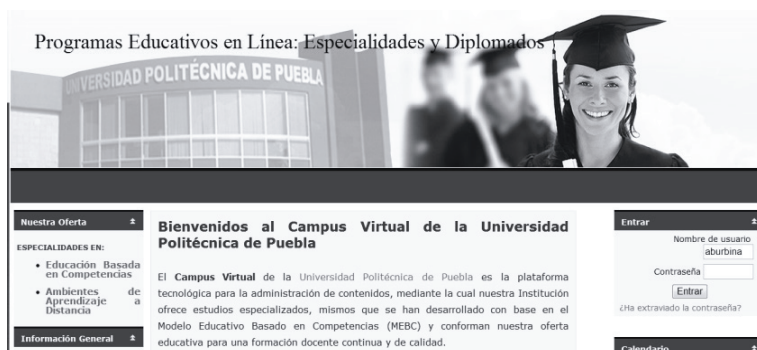
Figura 1. Campus Virtual Universitario

Para el diseño de la interfaz del CVU se consideró el perfil del usuario y el diseño estratégico (Smashing Media GmbH, 2012), el diseño y desarrollo de contenidos se basaron en la aplicación del modelo ADDIE de diseño instruccional (Strickland, 2010).