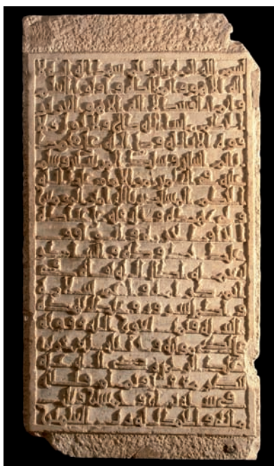
Figura 13. Inscripción n.º 76

7.76. Conmemoración de la construcción de un edificio religioso (?), 358 / 25 noviembre 968 - 13 noviembre 969: «Ordenó (...) al-Ḥakam [II] (...) esta construcción. Y fue terminada (...) bajo la dirección de (‘ alà yaday ) su mawlà y ḥāḡib Ğa‘far b. ‘Abd al-Raḥmān (...), con la inspección de ( bi-naẓar ) Ma‘qil y Tammām, sus fatàs » 190 .