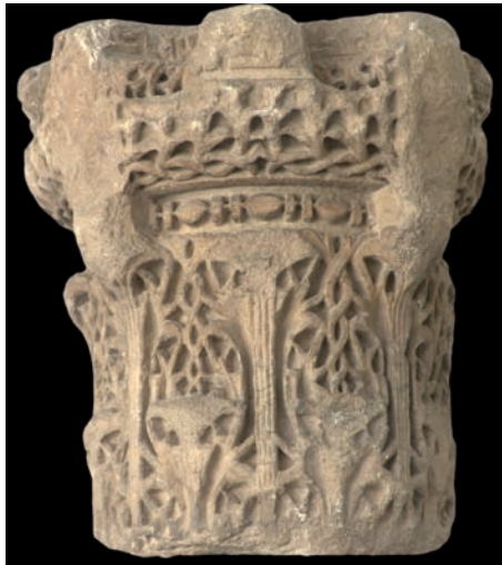
Figura 14. Inscripción n.º 81

7.81. Conmemoración de construcción en la cinta del ábaco y una cartela de un capitel, ca. 350-60 / 20 febrero 961 - 23 octubre 971, no consta. Cinta: «[De lo que orde]nó hacer y se terminó con el auxilio de Dios [bajo la dirección de ( ʿalā yaday ) su mawlā y ḥāǧib ] Ĝaʿfar b. ʿAbd [al-Raḥmān]»; cartela: «[Obra] de Badr» 195 .