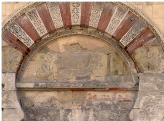
Figura 1. Inscripción n.º 3

7.4. Conmemoración de la [re]construcción de una azacaya en Écija (?), muḥarram 318 / 3 febrero - 2 marzo 930. Texto principal: «Ello se terminó con el auxilio de Dios bajo la dirección de (‘alà yaday) su mawlà y ‘ āmil Umayya b. Muḥammad b. Šuhayd»; cartela en el margen inferior: «De la obra de Fath, ḡulām del Emir de los Creyentes, glorifíquelo Dios» 118 .