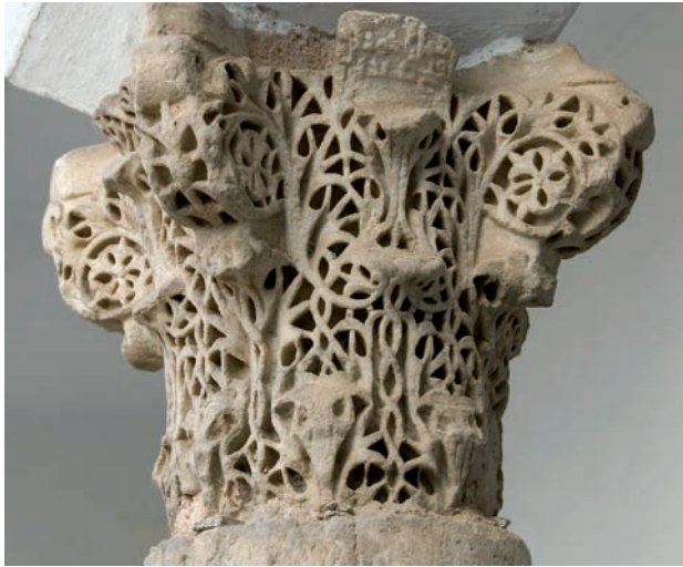
Figura 18. Inscricción n.º 98: conjunto

7.98. Firma en una cartela de un capitel reutilizado en el antiguo convento de Jesús Crucificado (Córdoba), tercer cuarto del siglo IV/X, no consta: «Obra de Aḥmad b. Faṭḥ, su 'abd» 212 .