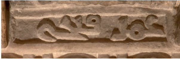
Figura 8. Inscripción n.º 67: 'Amal Faṭḥ

7.67. Conmemoración de obras de al-Ḥakam II en la Mezquita Aljama de Córdoba (zócalo inferior del interior del mihrab), dū l-ḥiġġa 354 / 28 noviembre - 27 diciembre 965. Faja epigráfica: «Mandó (...) al-Ḥakam [II] (...), tras la asistencia de Dios en lo que erigió de este mihrab y revestirlo de mármol (...). Y ello se terminó bajo la dirección de ( ʿalà yaday ) su mawlà y ḥāġġib , Ġaʿfar b. ʿAbd al-Raḥmān (...), con la inspección de ( bi-naẓar ) Muḥammad b. Tamliḥ, Aḥmad b. Naṣr y Ḥald b. Hāšim, sus aṣḥāb al-šurṭa , y de Muṭarrif b. ʿAbd al-Raḥmān, el kātib , sus ʿabds »; entre canecillos de sujección: «Obra de Faṭḥ y Ṭarīf; obra de Naṣr, su ʿabd , obra de Badr, su ʿabd » 181 .