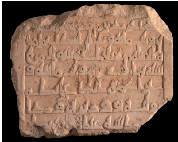
Figura 3. Inscripción n.º 7

7.7. Conmemoración de obras de construcción de un qanāt , 29 šafar 329 / 3 diciembre 940: «Todo ello fue realizado bajo la dirección de ('alà yaday) su mawlā , visir y zalmedina 'Abd Allāh b. Badr» 121 .