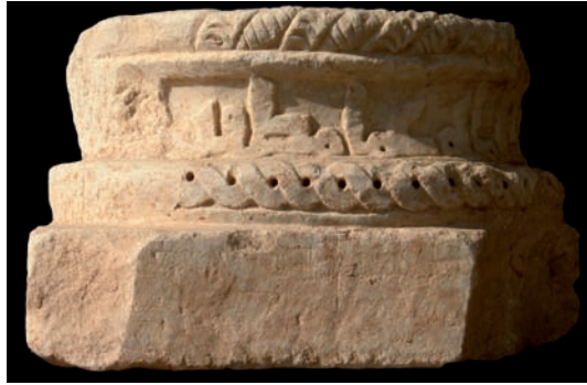
Figura 4. Inscripción n.º 34

7.35. Firma en una cartela de capitel del Salón de ‘Abd al-Raḥmān III en Madīnat al-Zahrā’, 342-345 / 18 mayo 953 - 3 abril 957, no consta: «Obra de Ṭarīf, su ‘abd» 149 .