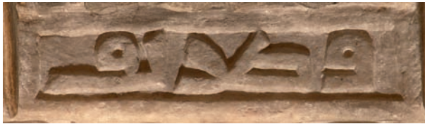
Figura 9. Inscripción n.º 67: Wa-Ṭarīf