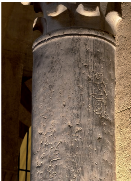
Figura 23. Inscripción n.º 107: C12n.F (dos veces ' Amal Fath )