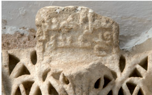
Figura 19. Inscricción n.º 98: detalle ('Amal Aḥmad bn / Faṭḥ 'abdi-hi)