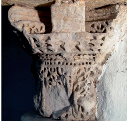
Figura 16. Inscripción n.º 96: conjunto

7.96. Firma en una cartela de un capitel compuesto reutilizado en el baño islámico de la calle Velázquez Bosco (Córdoba), tercer cuarto del siglo IV/X, no consta: «Obra de Aflaḡ, su ‘abd » 210 .