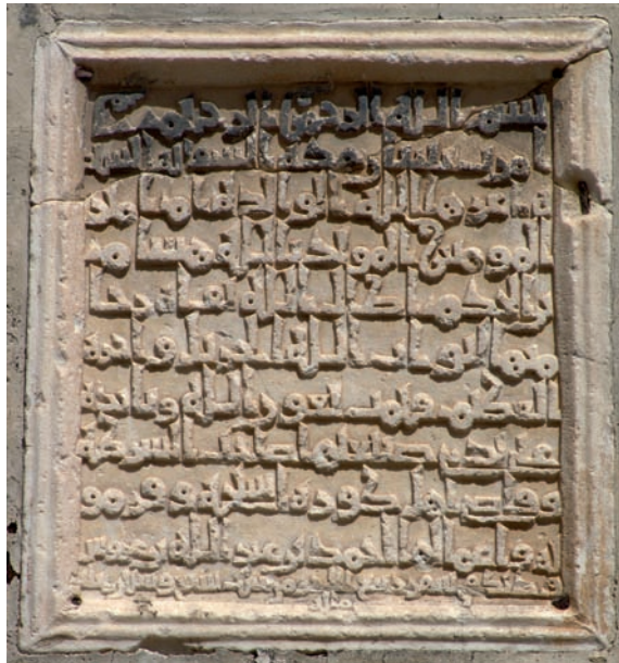
Figura 21. Inscripción n.º 104

7.104. Conmemoración de la [re]construcción de una azacaya en Écija, rabī c II 367 / 16 noviembre - 14 diciembre 977: «Ordenó ( amarat ) la [re]construcción de esta azacaya al-Sayyida al-Wāliḍa , Umm del Emir de los Creyentes, al-Mu‘ayyad bi-llāh Hišām b. al-Ḥakam. Y fue terminada (...) bajo la dirección de (‘ alā yaday ) su ṣanī‘a , ṣāhib al-šurṭa y cadí de las gentes de la cora de Écija y Carmona y sus ‘ amales , Aḥmad b. ‘Abd Allāh b. ‘Arūs» 218 .