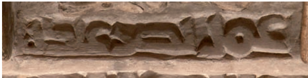
Figura 10. Inscripción n.º 67: 'Amal Naṣr 'abdi-hi