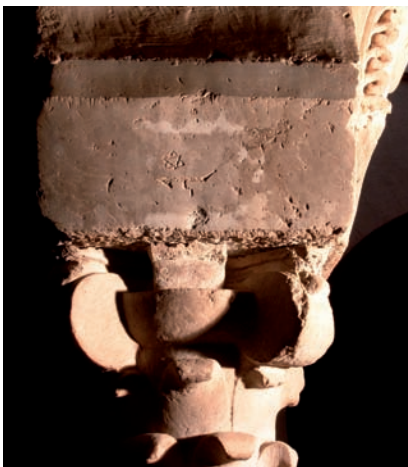
Figura 25. Inscripción n.º 107: D14.C (Ḥakam y un sello de Salomón)