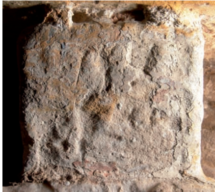
Figura 17. Inscripción n.º 96: detalle (‘Amal Aflaḡ / ‘abdi-hi)