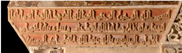
Figura 6. Inscripción n.º 66 (imposta derecha)

7.66. Conmemoración de obras de al-Ḥakam II en la Mezquita Aljama de Córdoba (impostas del mihrab), dū l-ḥiǧǧa 354 / 28 noviembre - 27 diciembre 965: «Mandó (...) al-Ḥakam [II] (...) a su mawlà y ḥāǧīb , Ğa‘far b. ‘Abd al-Raḥmān (...) fijar estas dos impostas» 180 .