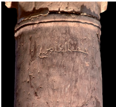
Figura 22. Inscripción n.º 107: G27.F ( Ḥalaf al-'Āmiri )

7.107. Signos lapidarios en elementos de columnas de la ampliación de Almanzor de la Mezquita Aljama de Córdoba, ca. 987-1000: Aflaḥ, Aflaḥ al-Farrā', 'Āmir, Bāšir, Bišr↔, Bušrā↔, Bušrā, Durri, Faraḡ, al-Farrā', Fath, Ḥakam, Ḥalaf, Ḥalaf al-'Āmiri, Ḥayra, Kāḥ (?), Mas'ūd↔, Maysūr↔, Mubārak, Mubārak b. Hišām, Muḥammad (?), Našr↔, Rizq, Sa'āda y Yaḥyā 221 .