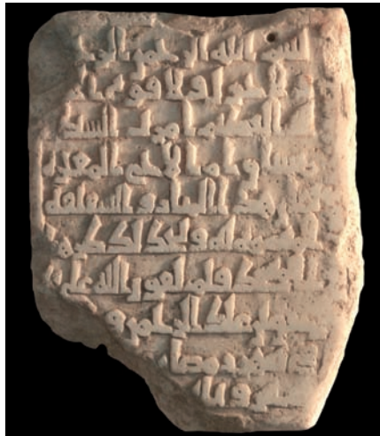
Figura 15. Inscripción n.º 92

7.92. Conmemoración de la construcción de varios elementos de una mezquita, ramadán 360 - ramadán 365 / 28 junio 971 - 1 junio 976: «Ordenó ( amarat ) la Sayyida Muštāq, Umm al-Aḥ al-Muġīra, [re]construir ( bi-bunyān ) este alminar y la azaquefa unida a él y renovar la decoración ( taġdīd turr ) de esta mezquita. Se terminó (...) bajo la dirección de (‘alà yaday) ‘Atīq b. ‘Abd al-Raḥmān, su f[atà] » 206 .