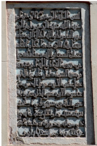
Figura 5. Inscripción n.º 36

7.36. Conmemoración de las obras de ‘Abd al-Raḥmān III en la fachada al patio del oratorio de la Mezquita Aljama de Córdoba, dū l-ḥiġġa 346 / 23 febrero - 24 marzo 958. Texto principal: «Y ello se terminó, con el auxilio de Dios (...), bajo la dirección de (‘alā yaday) su mawlā , visir y zalmedina ‘Abd Allāh b. Badr»; explícit: «Obra de Sa‘īd b. Ayyūb» 150 .