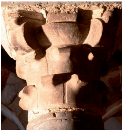
Figura 24. Inscripción n.º 107: F1.K (Sa'āda)