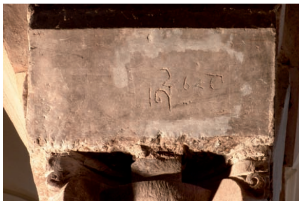
Figura 27. Inscripción n.º 107: D3.C ( Aflaḥ wa-Durri )

7.108. Tres firmas en sendas cartelas de un capitel geminado conservado en el Museo Arqueológico de Córdoba, 976-1002 (regencia de Almanzor), no consta: «Obra de Bāšir - Obra de Faraḡ - Obra de Mubārak» 222 .