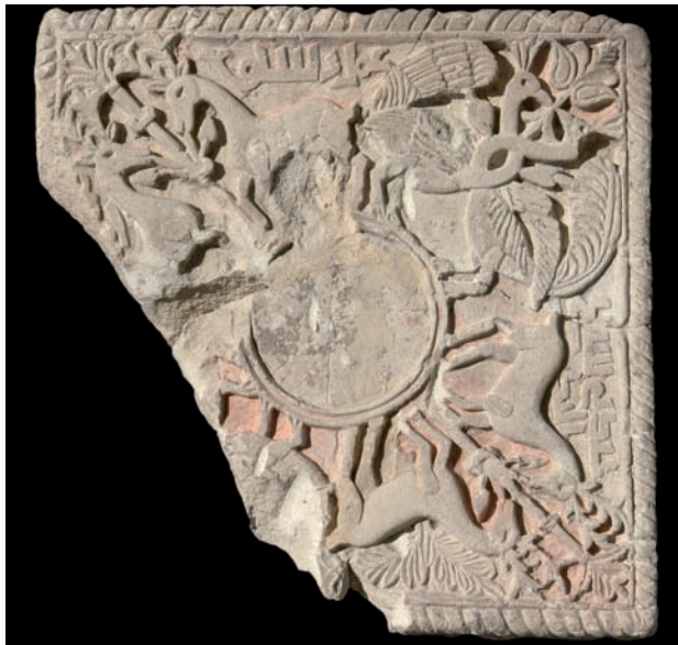
Figura 20. Inscripción n.º 101

7.101. Firma en una placa decorativa procedente del «Gran Pórtico» de Madīnat al-Zahrāʾ, 940-76 (obras en Madīnat al-Zahrāʾ), no consta: «Obra de Rašīq y عبدى بسح الند» 215 .