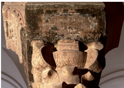
Figura 26. Inscripción n.º 107: G31.C (Mubārak bn Hišām)