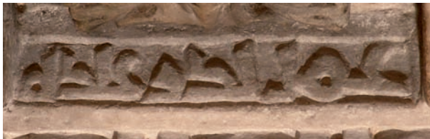
Figura 11. Inscripción n.º 67: 'Amal Badr 'abdi-hi