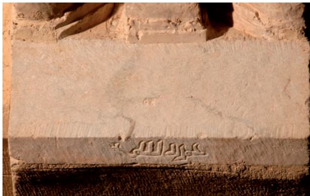
Figura 12. Inscripción n.º 72: ‘Amal Rašīq

7.72. Signos lapidarios en elementos de columnas de la ampliación de al-Ḥakam II de la Mezquita Aljama de Córdoba, 961-67: Aflaḥ, Badr, Ibn Naṣr, Muḥammad (?), Naṣr, Qāsim y Rašīq 186 .